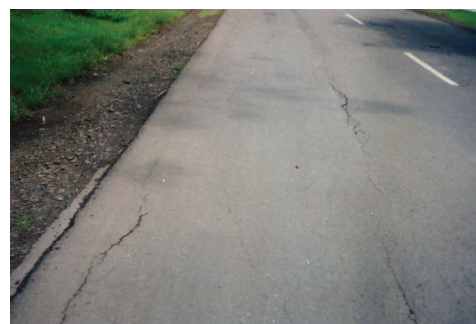
Kerusakan jalan, Ruas Tirtoyudo KM 5,5 Kabupaten Malang

Di Indonesia, jumlah kerugiannya belum dilaporkan secara rinci, namun dari penelitian dan survei yang telah dilakukan oleh pihak Bina Marga dan Pusat Penelitian dan Pengembangan Jalan Departemen Pekerjaan Umum tahun 1992, banyak kerusakan yang terjadi pada beberapa ruas jalan di Pulau Jawa