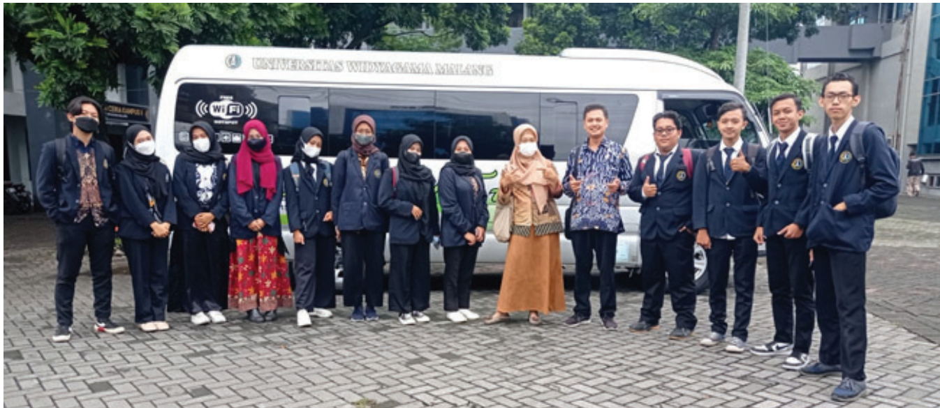
Keberangkatan Finalis Lo Kreatif menuju Acara Closing Ceremony di UBAYA

Ada hikmah yang dapat dipetik dari Pandemi Covid. Walau semua hal secara umum dilakukan secara daring akibat pembatasan aktivitas sosial, tidak menyurutkan semangat mahasiswa dalam berpartisipasi pada ajang lomba. Salah satu ajang lomba yang mampu memunculkan berbagai kreatifitas dan inovasi mahasiswa adalah Lo kreatif. Ajang bergengsi ini merupakan lomba tingkat nasional yang diselenggarakan oleh Aptisi Wil. VII Jatim dan beberapa PTS sebagai co-host. Tahun 2020 adalah permulaan pelaksanaan lo kreatif, yang kemudian diselenggarakan secara konsisten setiap tahunnya sampai dengan saat ini. Adapun kategori lomba pada tahun 2020 adalah ide bisnis, desain poster, video pendek, aplikasi web/ mobile, desain UI/UX aplikasi mobile/web. Kategori lomba kemudian bertambah pada tahun 2021, yaitu lomba fotografi, game, tiktok dan unjuk talenta. Untuk tahun 2022, selain kategori lomba yang pernah diselenggarakan di tahun sebelumnya, bertambah lagi yaitu kategori animasi dan komik. Sehingga total kategori lomba adalah menjadi 10 (sepuluh) lomba.