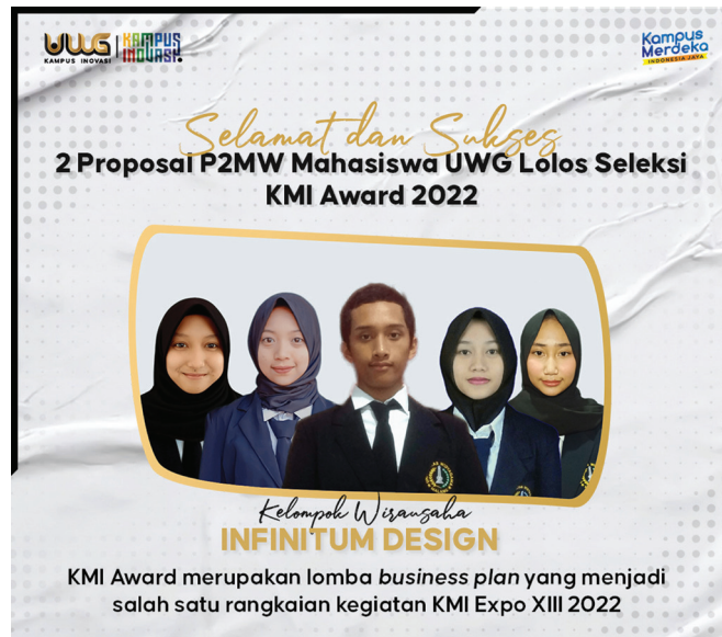
Samosa Pohong Kare lolos seleksi KMI Award 2022, suatu pencapaian besar hingga tim dapat melangkah sejauh itu. (san/pip*at)

Meski menghadapi tantangan dalam hal mengintensifkan