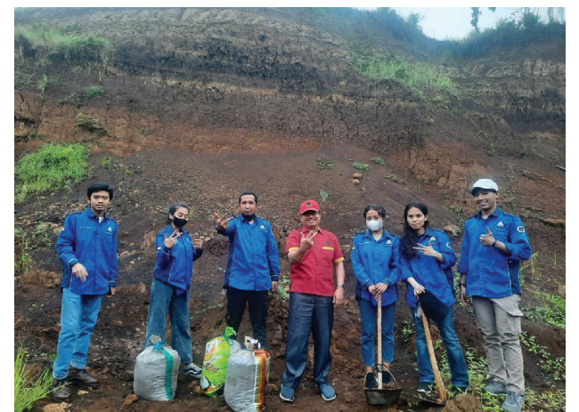
Tim Geoteknik Universitas Widyagama Malang di Lokasi Sampel Tanah Ekspansif Tirtoyudo

Perilaku tanah ekspansif pada wilayah Malang selatan hingga Lumajang Selatan diartikan tanah ekspansif dengan tingkat swelling dari tinggi sampai sangat tinggi, sehingga harus diwaspadai saat musim hujan, untuk dapat mengatur aliran air hujan pada draenase-draenase yang ada